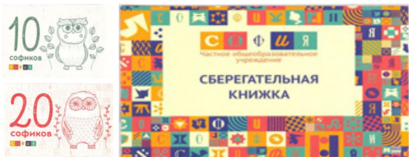
Рис. 1. Софики и сберкнижка

игры, игровое поле. Чтобы игрокам было привычно, решил использовать в игре школьную валюту «Софики» и сберкнижки из школьного банка.