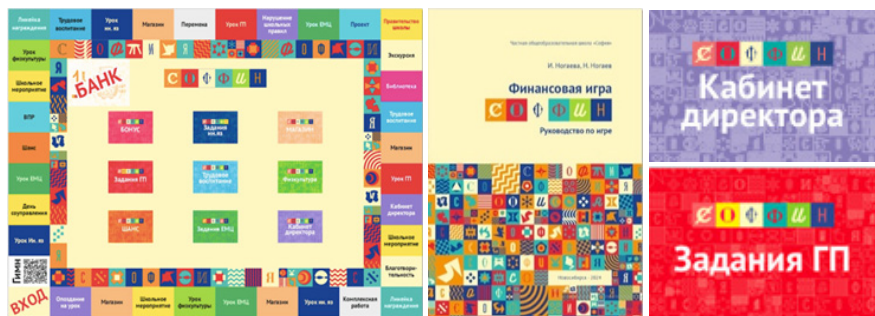
Рис. 2. Игровое поле, руководство и карточки

В данной игре представлены различные клетки, на которых игрок выполняет разные задания. На клетках школьных предметов он должен блеснуть своими знаниями и правильно ответить на вопрос. Есть как поощрительные поля, такие как шанс и линейка награждения, на которых игрок может получить бонусы, так и поля, такие как перемена, экскурсия, нарушение школьных правил и опоздание на урок за которые игроки оплачивают штраф. На клетках гимн, школьное мероприятие и школьное правительство игрок может проявить свои таланты. На полях: день самоуправления, проект, библиотека, кабинет директора игрок проверяет свою удачу. На клетках поля: магазин, ВПР, комплексная работа и благотворительность игрок использует свои средства для осуществления финансовых процессов.